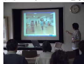
前回の講座の様子